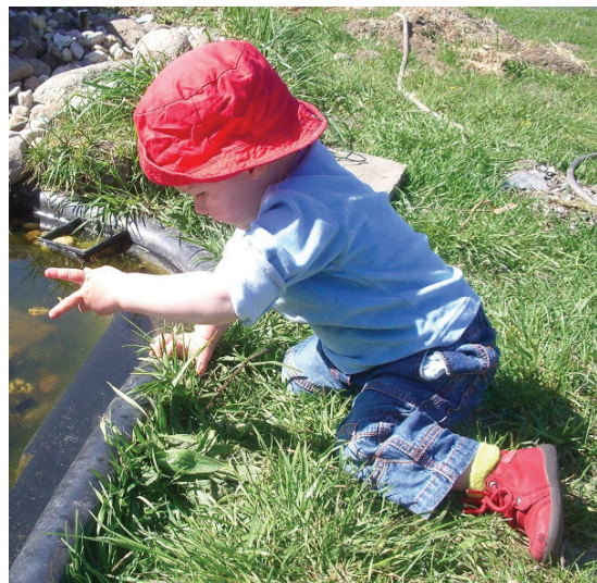
Rahel hat im Teich eine „Schnecke“ entdeckt.

Wir sind ständig auf der Suche nach niedlichen Babyzeichenfotos, die wir in unser Archiv aufnehmen und für Veröffentlichungen nutzen dürfen. Wenn es Ihnen gelingt, Ihr Kind beim Kommunizieren mit Zwergensprache zu fotografieren, können Sie sich an unserem Fotowettbewerb beteiligen. Senden Sie uns dazu einfach Ihr schönstes, niedlichstes, aussagekräftigstes Foto per E-Mail. Den Gewinnern winken attraktive Preise!