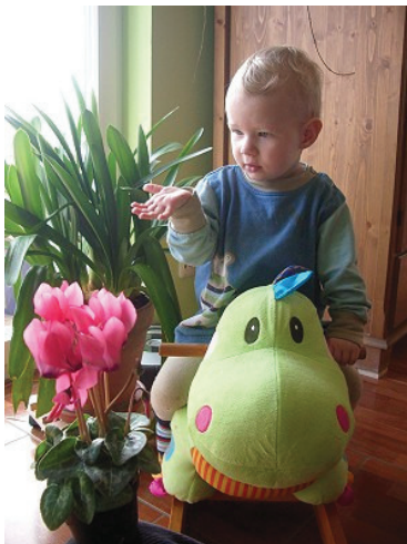
Rahel zeigt „Blume“.